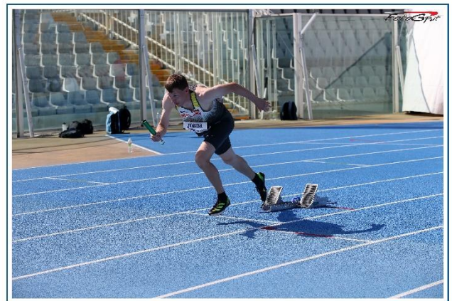
EUROPEAN MASTERS ATHLETICS CHAMPIONSHIPS STADIA - ITALY 2023